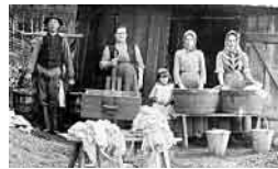
Stortvätt på 1910-talet i Haninge.

De många tvätterierna gav familjerna extra inkomster. De blev till en viktig näring i trakten liksom de otaliga trädgårdsmästerierna i Tungelsta.