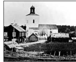
Västerhanninge kring år 1870. Kyrka, kaplansgård, kyrkskola och tingshus.

Skogen var en viktig inkomstkälla för bönderna. Den gav timmer och ved till hushållet. Dessutom kunde en del säljas till stadsborna i Stockholm.