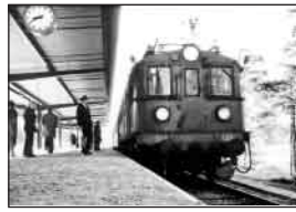
Första tåget vid nya stationen i Handen år 1973. Ej pendeltåg.

1971 slås Österhaninge och Västerhaninge kommun ihop. Den nya kommunen får namnet Haninge.