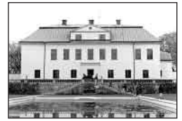
Häringe slott.

Under 1700-talet skedde en kraftig ökning av antalet herrgårdar i häradet. Nästan all jord kom att tillhöra adeln.