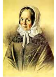
Fredrika Bremer född 1801. Porträtt av Annelie Tottie, 1849.