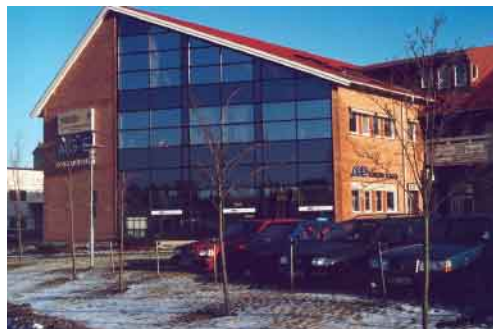
Ilvis Media finns i Prismahuset vid Söderbyleden.