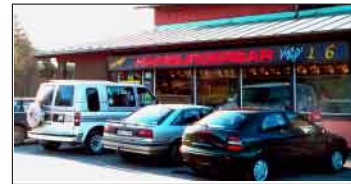
Vegabaren vid Nynäsvägen i Haninge.

Det anrika Söderby krog var beläget intill Nynäsvägen i Vega, Haninge. Krogen var verksam under 1600- och 1700-talet. Huset finns kvar än idag. Traditionen har förts vidare av Hamburgerbar, som ligger snett över vägen. Det är Sveriges första hamburgerbar, även kallad Vegabaren.