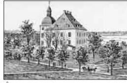
Årsta. Kopparstick.

l = l, lo gr , ett runtecken som betyder vatten eller hav. Kan även betyda livskraft.