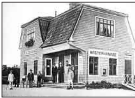
Västerhaninge station, 1902. Det revs 1973, då pendeltågstrafiken infördes.