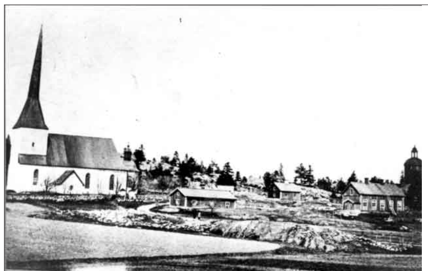
Österhaninge kyrka, fotograferad från söder någon gång mellan 1861-1876.

Animeringar åskådliggör hur landskapet har förändrats genom tiderna. De beskriver hur och var de olika samhällena har uppkommit och skildrar livet på de tidiga bosättningarna.