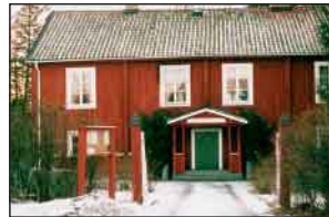
Sotholms härad var tingsäte redan på 1600-talet. Tingshuset i Västerhanninge är från 1700-t. Där fanns en krog. Tingshus-salen på övervåningen kom till ca 1820.

Ärende år 1775: Två pigor stämmer sin husbonde för att han beskyllt dem för "otrohet i tjänst och med hugg och slag överfallit dem".